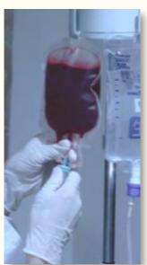
骨髄移植は点滴で行われます。

骨髄移植は造血細胞を他の人の健康なもの置き換える治療方法です。「移植」ですので、その造血細胞を提供する「骨髄ドナー」の協力が必要となります。