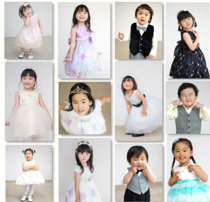
協力: 読者モデルさんたち

ピアノの発表会、結婚式などに便利！素敵なお衣装がお安く・手軽 に借りれる！レンタル・返却方法はとても簡単！レンタル方法や 料金などの詳細は、右下のQRコードからご覧ください！